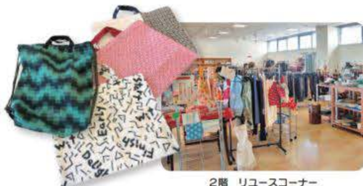
2階 リユースコーナー

不要になったけどまだまだ使えるものは、ぜひ持ち込みを。受付時間や対象品目はホームページをご参照ください。