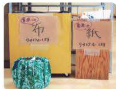
講座中に出たごみもリサイクル