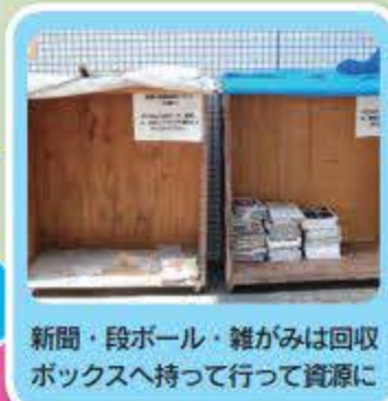
新聞・段ボール・雑がみは回収ボックスへ持って行って資源に