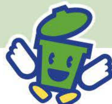
ごみ減量シンボルマーク「かーるちゃん」

ステイホームの日々、家のごみが増えた、と感じていませんか。福岡市の家庭から、年間約26.9万トンの燃えるごみが出されています。その内訳を見ていると、まだまだ活かせるものがたくさん！もったいないですね。ごみを出す前に見直して資源化することは、SDGsの取り組みになります。できることから始めましょう！臨海3Rステーションは、そのお手伝いをします。