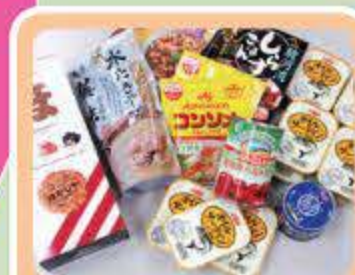
未使用・未開封の食べきれないものはフードドライブで有効活用