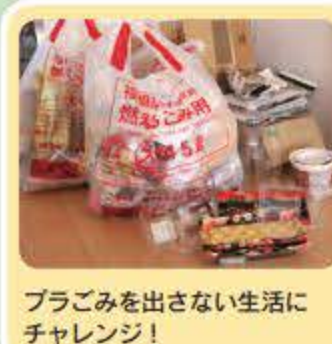
プラごみを出さない生活にチャレンジ！