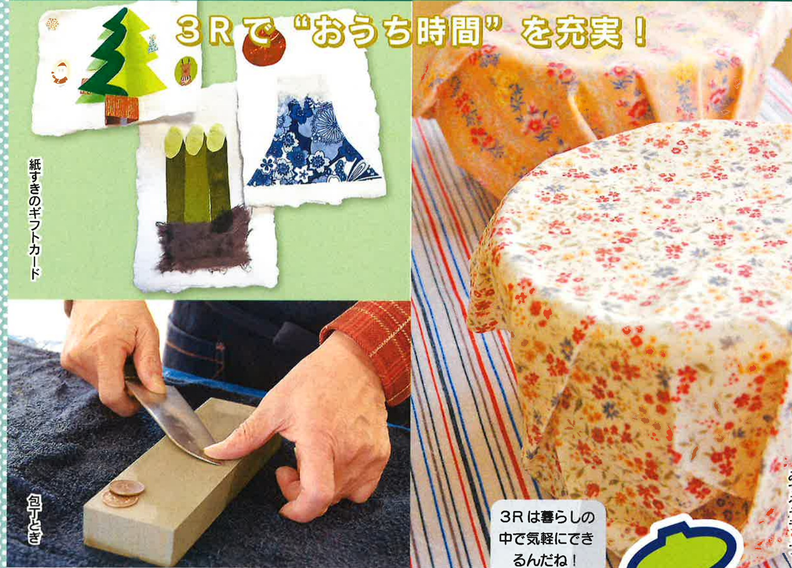
紙すきのギフトカード