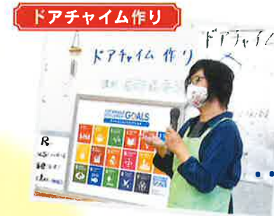
ドアチャイム作り