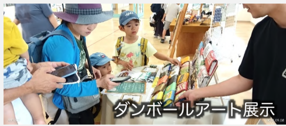
ダンボールアート展示