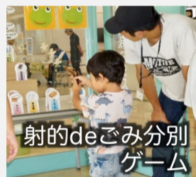
射的deごみ分別ゲーム