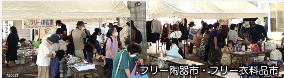
フリー陶器市・フリー衣料品市