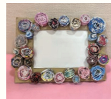
▲ダンボールフォトフレーム