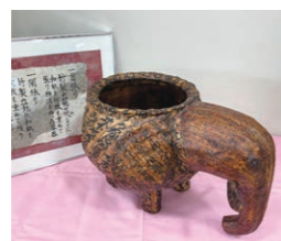
竹製の籠に和紙を張り 柿渋を塗った「一貴張り」