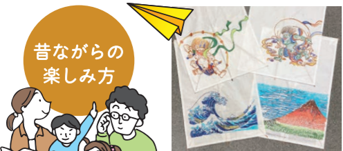
紙飛行機や 駒・凧などで遊ぶ