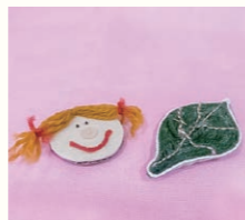
▲ダンボールマグネット