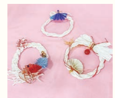
▲牛乳パックの紙紐でミニしめ縄づくり

ほかにも単発で古紙を使った無料体験を行っています。今まで開催したものです。アイデアの参考にしてください。