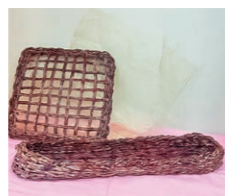
チラシで作った籠