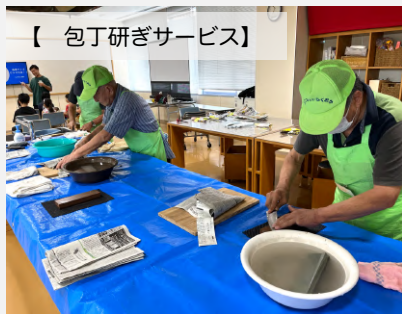
【包丁研ぎサービス】

9月10日にイーコトフェスタを開催しました。大勢の皆様にお越しいただいて大盛況でした。