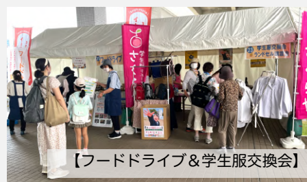
【フードドライブ&学生服交換会】