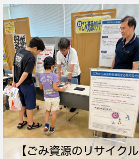
【ごみ資源のリサイクル】