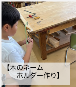
【木のネーム ホルダー作り】