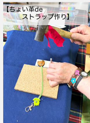
【ちょい革de ストラップ作り】