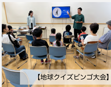
【地球クイズビンゴ大会】