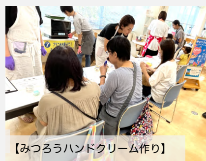
【みつろろハンドクリーム作り】