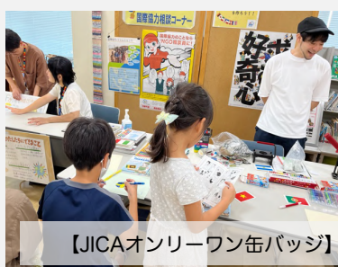
【JICAオンリーワン缶バッグ】