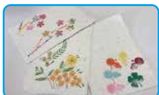
紙すきでハガキ作り