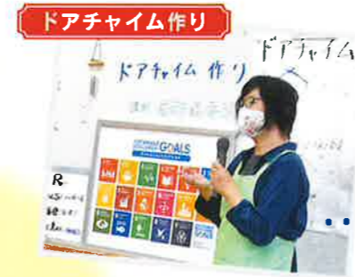
ドアチャイム作り