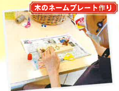
木のネームプレート作り