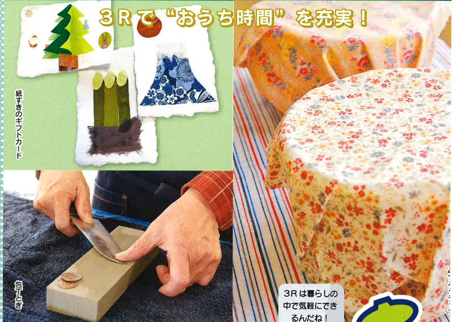
紙すきのギフトカード